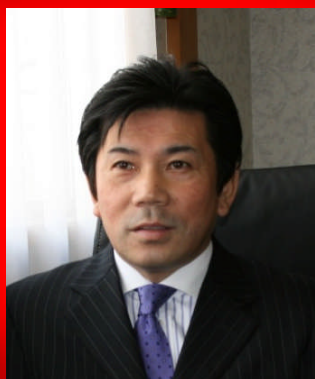
株式会社ハートフルタクシー 副社長